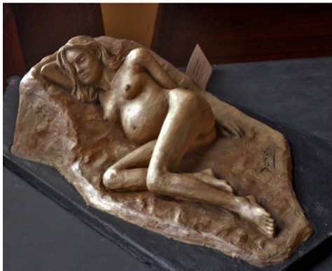
“Maternidad III” (Acrílico - 50x30x15 cm – 2010)