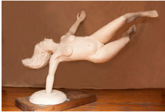
“Voy a dormir” (Resina de poliéster, 140x80x90cm, 2012)