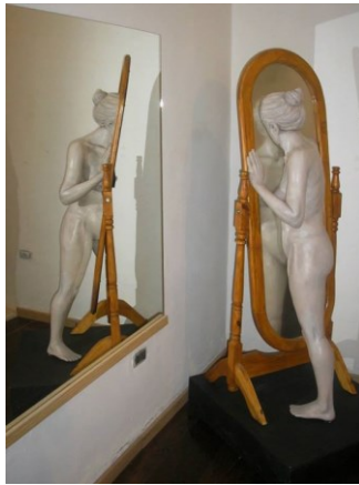
“A través del espejo” (Resina, 60x80x170cm, 2014)