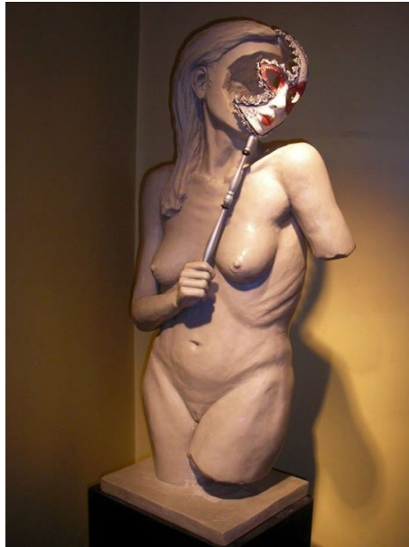
“Otreddad” (Resina de poliéster, 30x35x100cm, 2014)