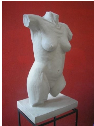
“Torso de mujer” (Resina - 30x40x70 cm - Año 2011)