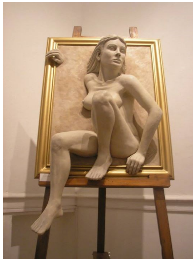
“Pasaje” (Resina de poliéster, 60x80x170cm, 2013)