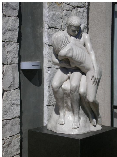
“Abrazo eterno” (Resina de poliéster, 80x80x180cm, 2012)